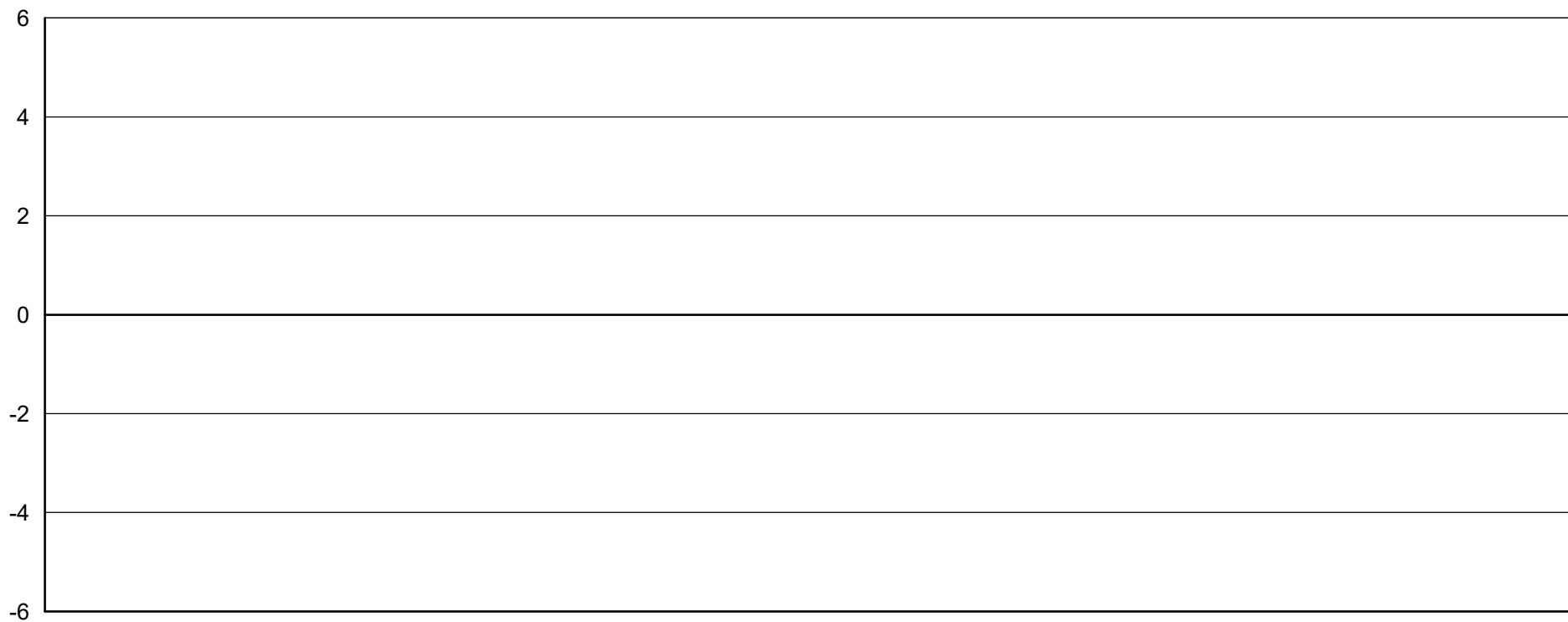
Solicitações por tipo de resposta